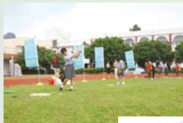
2010年9月16日 第2次希望列車教學

每學期實施馬拉松比賽，檢驗親師生運動成果，喚起全民運動風氣。配合游泳課程及自行車教學，六年級畢業之前實施小鐵人認證，通過檢測者，於畢業典禮上頒發畢業證書。