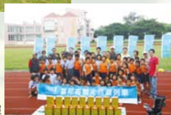
2010年9月16日 第2次希望列車合照