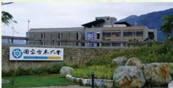
國立臺東大學大學校園

未來繼續發揮本校辦學理念與人才培育宗旨，建構完整之培訓課程及實習互動網路平台，使在校學生可透過本平台接受新知，及了解相關實習經驗，將發展完整之職前教師培訓學程，為專業培育服務遍遠之各學校師資為特色的師資培育機構，以提昇學生的專業精神，期許學生能在專業知能與專業精神的訓練中，具有更堅強的競爭力。